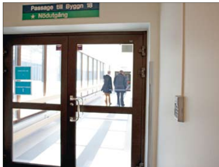
Totalt är det cirka 420 läsare installerade på sjukhuset.