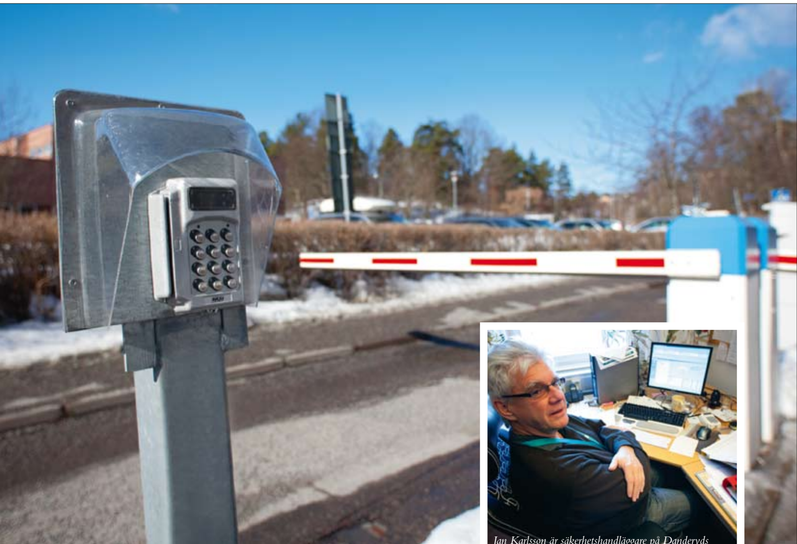
Bilstölderna har helt upphört sen man installerat bom och kortläsare till parkeringar och garage.