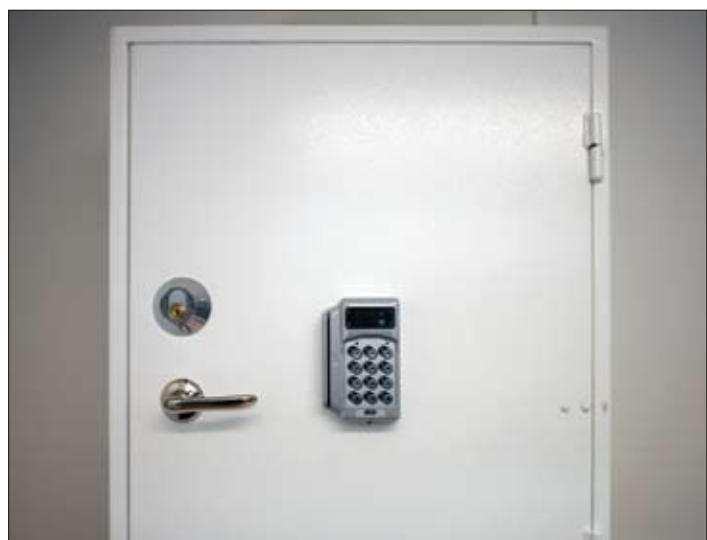
Även på avdelningarnas medicinskåp är läsare installerade.