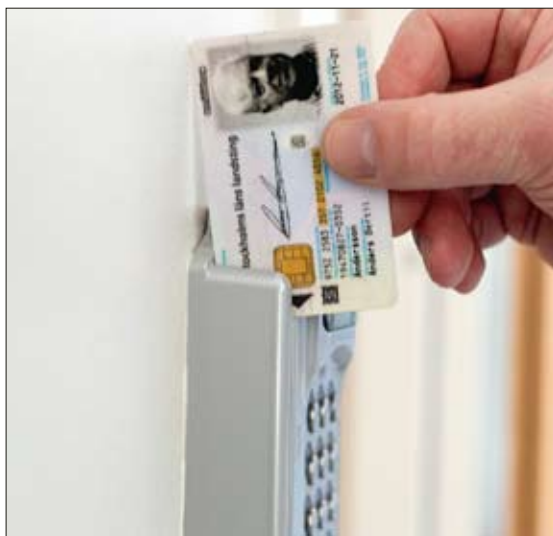
Nästa steg är att alla anställda i år kommer få ett nytt E-tjänstekort.